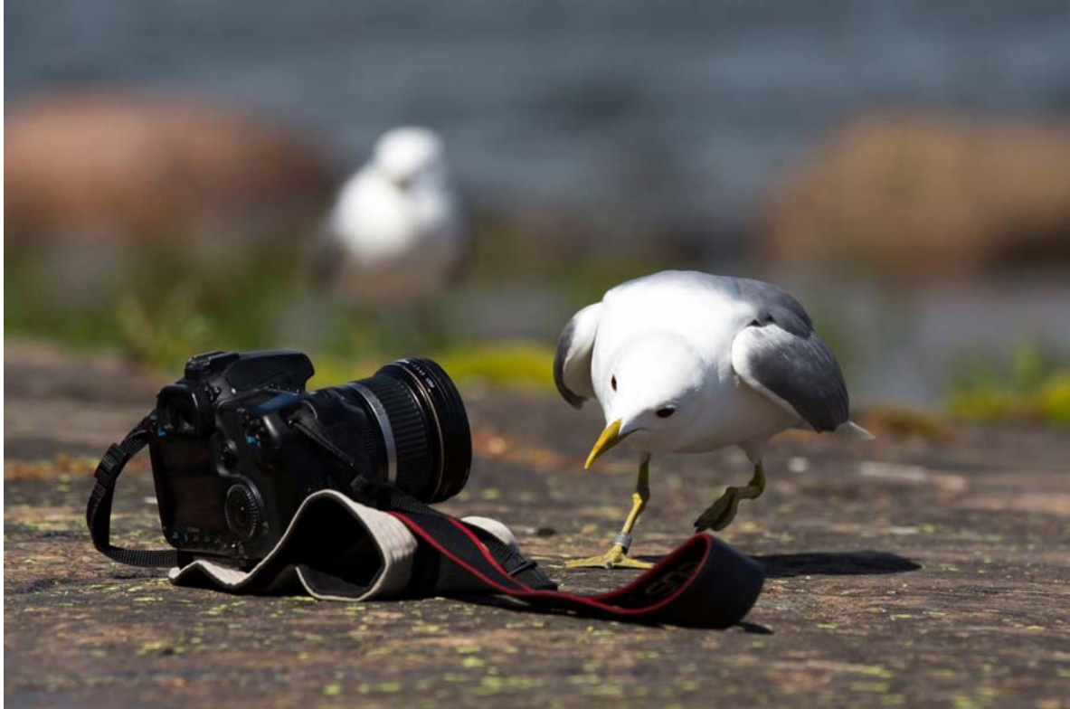
Nyfiken, Staffan Weckman (Kamera 67)