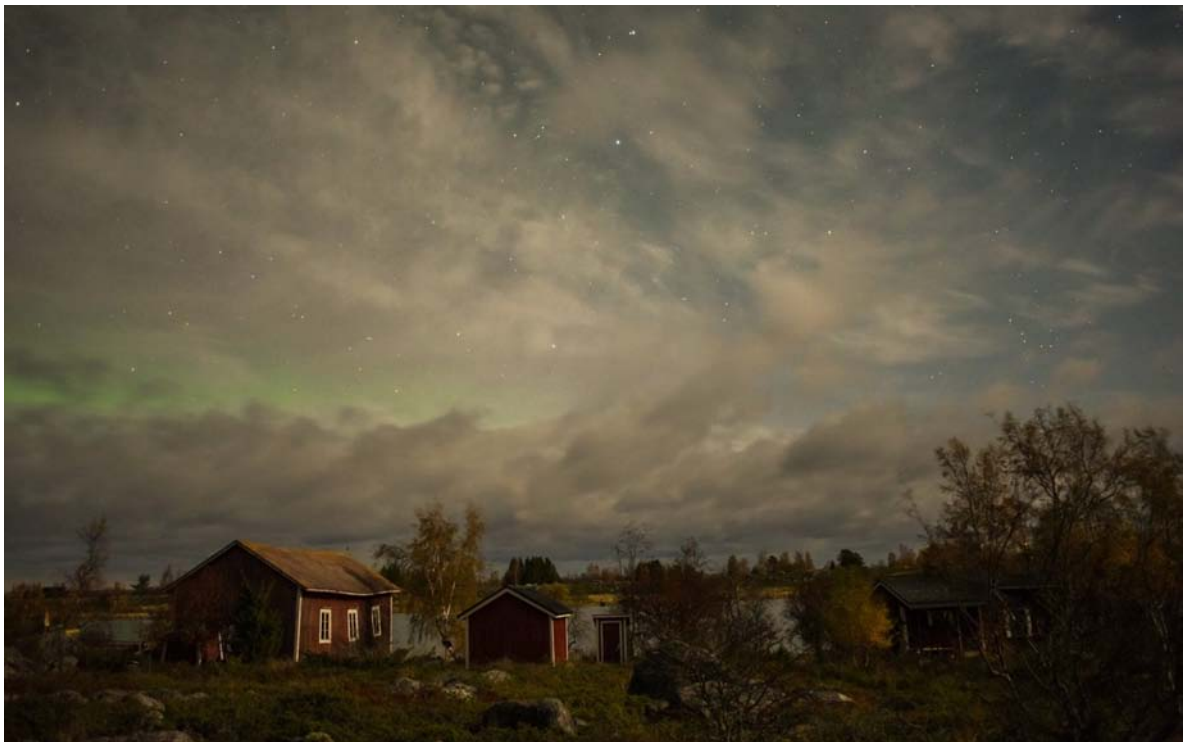
Höstkväll, Tuija Warèn (FK)