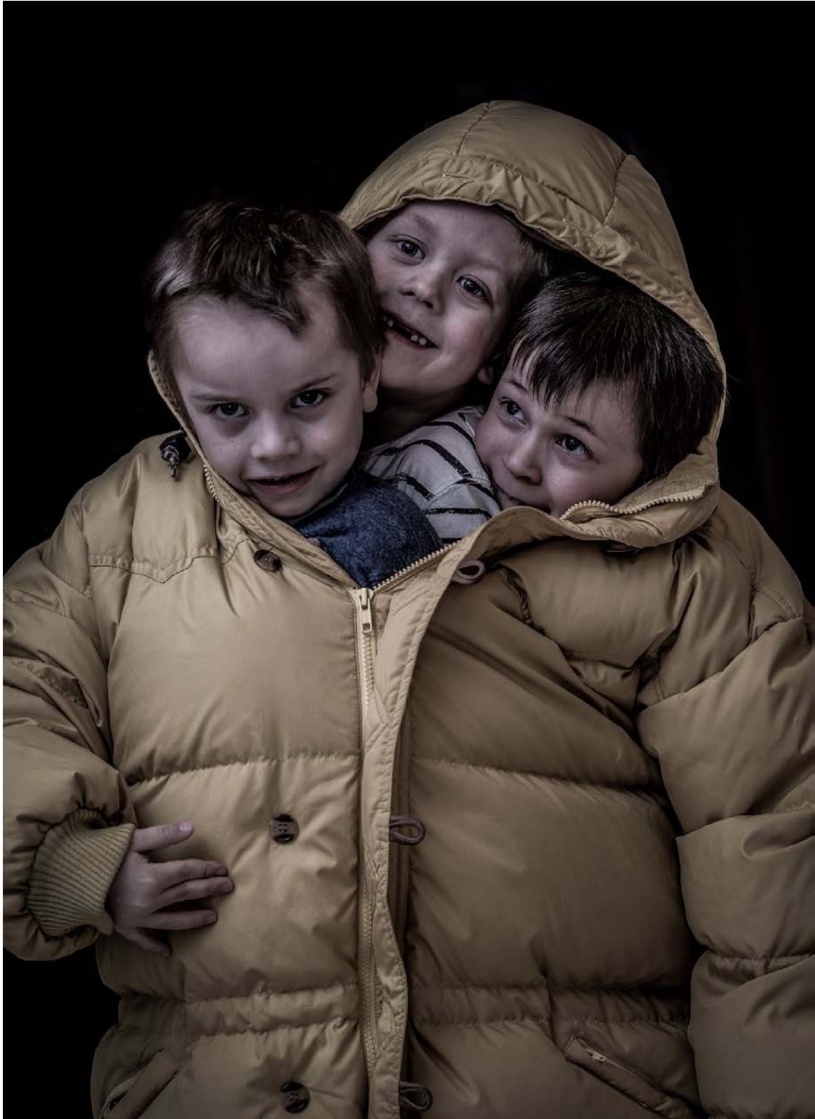
3. Busfrön i trepack, Johan Strand, FotoklubbenKnäppisarna Busigt, tre glada som har kul tillsammans, nära, fin kontakt, fin komposition, mjuk lätt ljussättning som lyfter fram bildens innehåll fint.