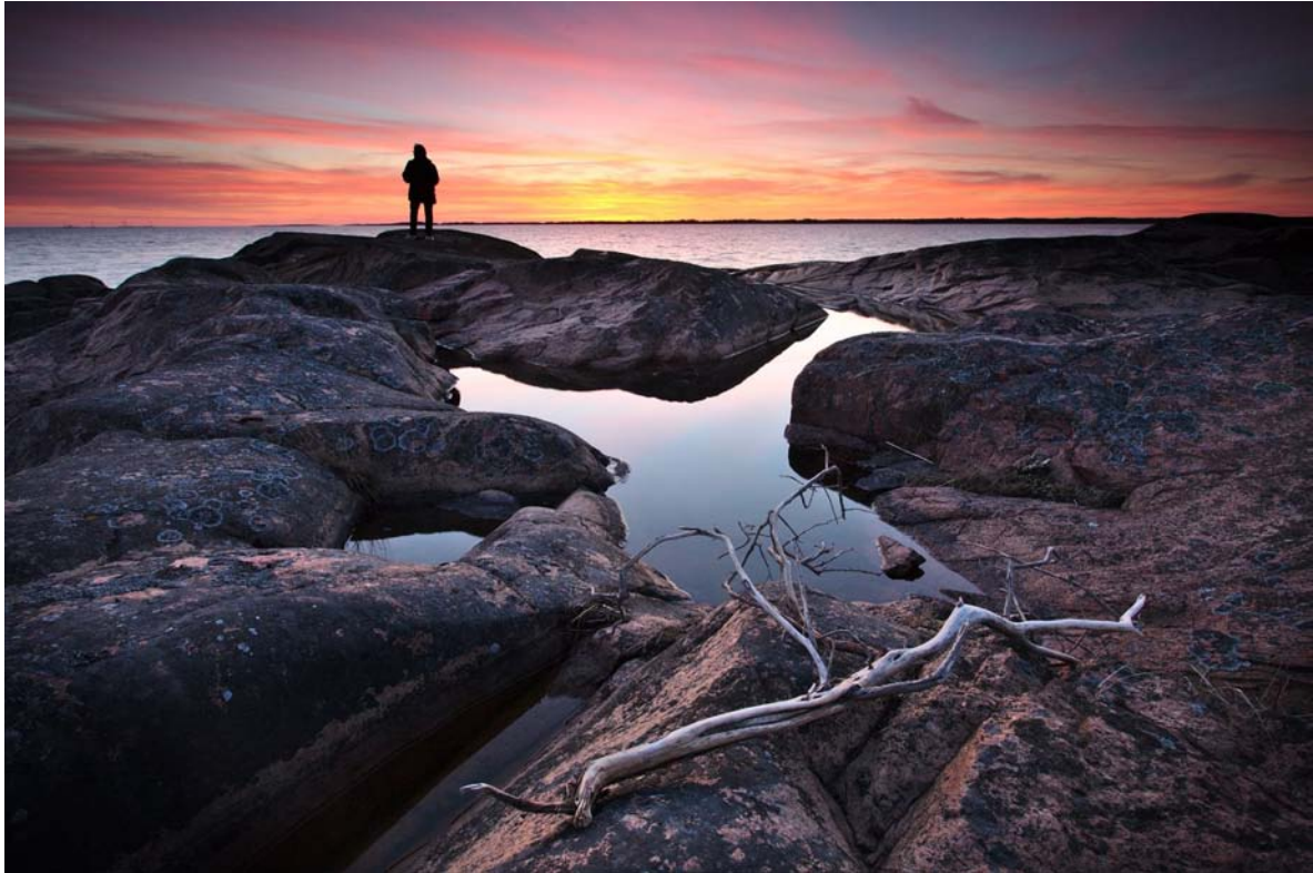
2 plats: "Herröskatan" Jan Sundman, Obscura

Bara en mogen och tänkande fotograf tar en sådan här bild! Bilden är fylld av symbolik. Den perfekt komponerade och vackra bilden av solnedgångslandskapet berättar något mer än att bara vara vackert. Där står en människa i bakgrunden, i siluett mot aftonrodnaden. Bakom henne lurar allas vårt öde; förgängelsen.