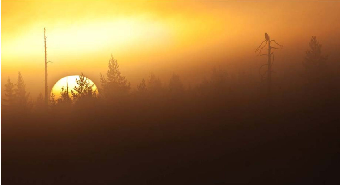
Morgonstund i björnlandet, Johan Geisor (FK)